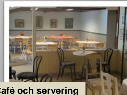
Café och servering